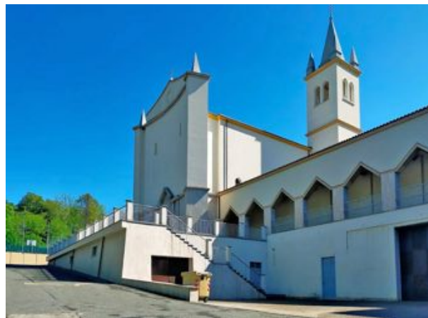
Monastero della Visitazione - Moncalieri (TO)

Che cosa può aver portato Dio a compiere un tale, impensabile passo? L'amore, soltanto l'amore. Egli infatti ci ha amato con amore di compiacenza (nel senso etimologico 'provare piacere con'), poiché ha posto le sue delizie nello stare con i figli degli uomini e attirare l'uomo a sé, facendosi uomo egli stesso. Ci ha amato con amore di benevolenza, comunicandoci la sua divinità, cosicché l'uomo fosse Dio. Ha unito la nostra natura umana alla sua natura divina con una unione incomprensibile, indissolubile ed eterna. Ha adattato la sua grandezza alla nostra piccolezza. In qualche modo ha la-