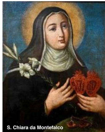
S. Chiara da Montefalco

La sorpresa è stata che ci ha raccontato dei suoi legami con Santa Chiara, che noi non sapevamo, e del legame con alcune chiese in America che sono a lei dedicate in cui lui ha celebrato alcuni eventi principali della sua vita, la professione, il diaconato. Non sapevamo di questo suo legame profondo con Santa Chiara, anche se, essendo nato il 14 settembre, giorno dell’esaltazione della Santa Croce, e Santa Chiara è detta Santa Chiara della Croce, si poteva immaginare questa “amicizia”. Però che avesse avuto delle date importanti e un legame così forte con la Santa non lo sapevamo e ci ha fatto tanto tanto piacere. Alla fine della Messa ha voluto andare dalla Santa, ha voluto che anche i suoi segretari la conoscessero. È stato un momento molto bello. (da www.vaticannews.va ) ✚